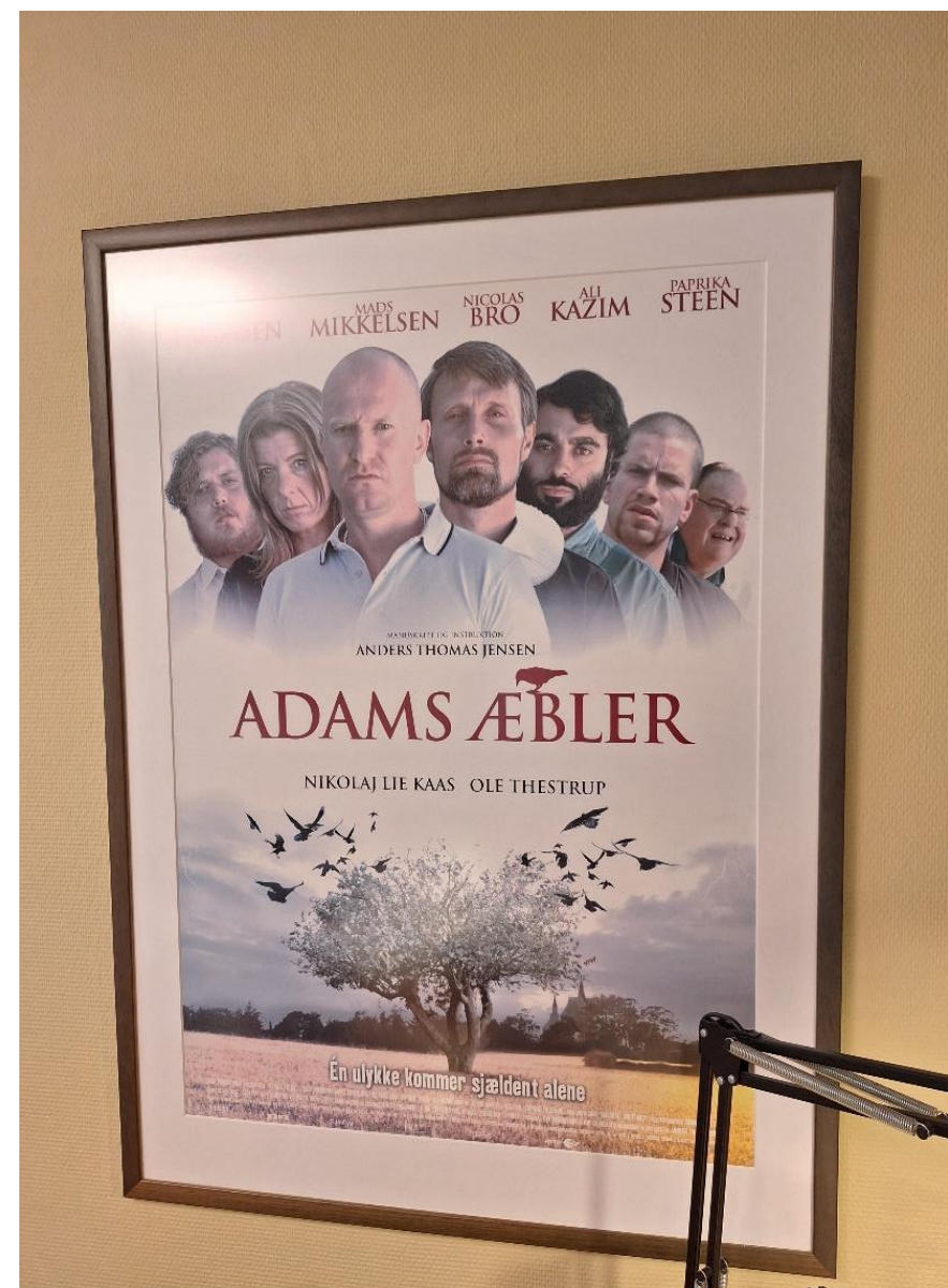
Plakaten, der hænger på mit kontor, fik jeg af Film-Fyn tilbage i 2004. Den har startet virkelig mange gode samtaler, når mennesker har været forbi i alle mulige andre sammenhænge.

De andre ideer, udover dem vi gennemførte i vinter og til påske, hvor der var en dejlig opbakning med flere hundrede deltagere og blev bragt på TV2 Fyn, vil forhåbentlig blive prøvet af og trimmet rundt om ved andre kirker på Fyn.