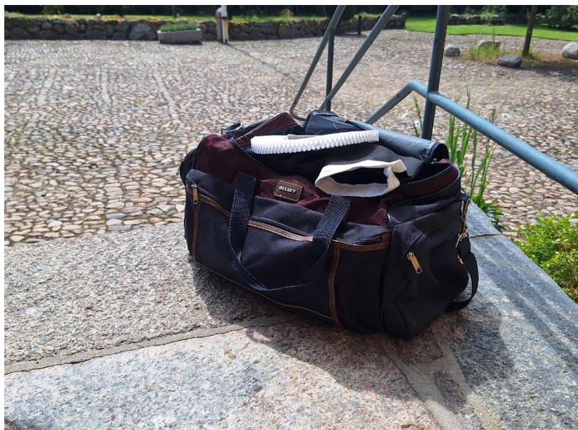
Kufferten er pakket, som så mange gange før. Denne gang skal den dog på daglig langfart for alvor...